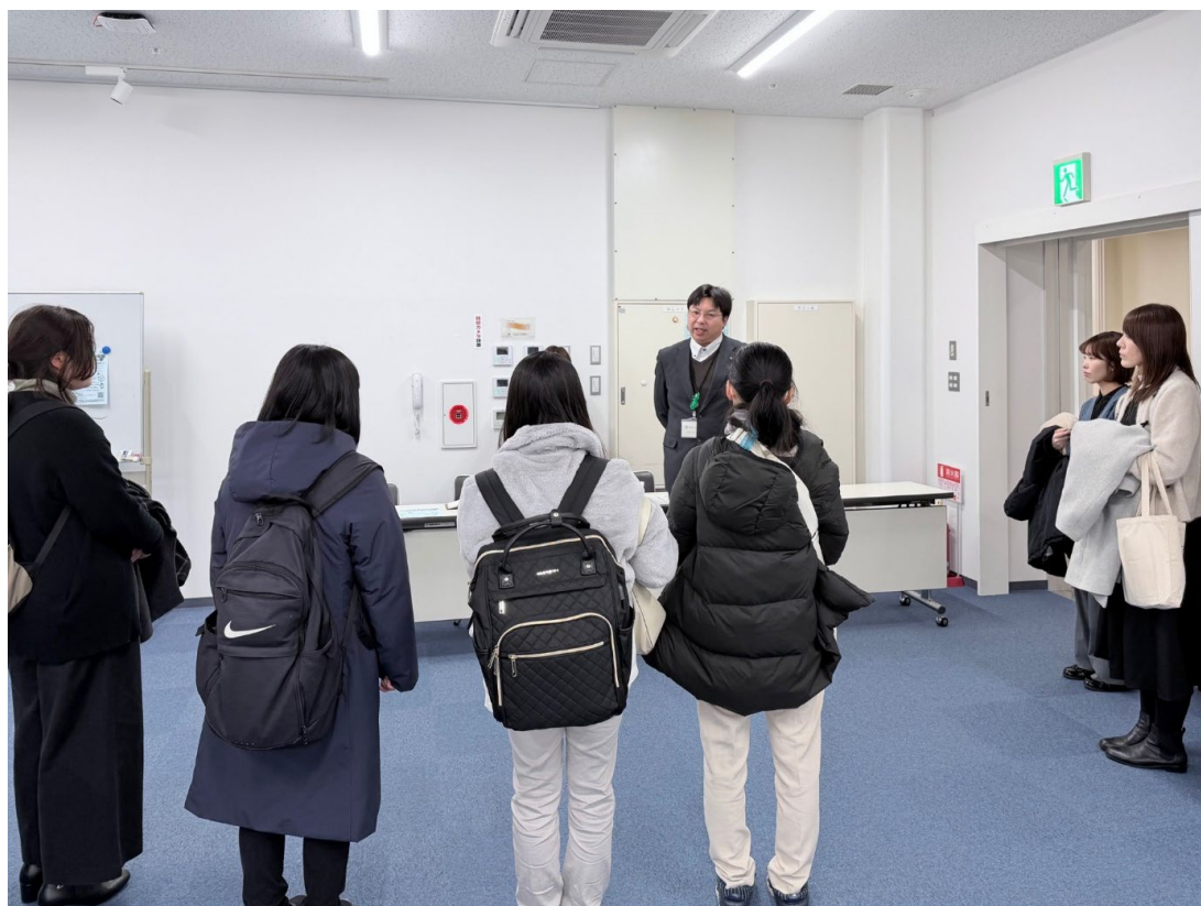
図4: 盛岡市中央公民館の展示室にて

http://www.art.iwate-u.ac.jp/musubinoha/