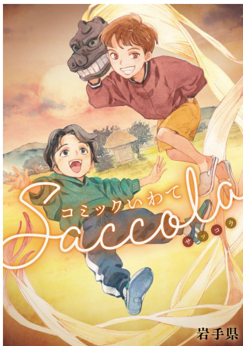
図1：『コミックいわて Saccola（サッコラ）』（「コミックいわて」第14巻）

そこで、「いわてのマンガ文化」の定着・発展を目指して、県内の子どもたちを始め、若年層の興味関心を高める取組や、来訪者が県内で作品に触れる機会の提供など、岩手県との協働で岩手大学の学生が応援することによって、「いわてマンガプロジェクト」の情報発信の強化と更なる定着に向けた方策の検討・取組を進める。