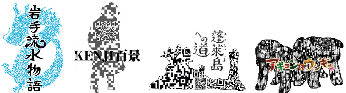
図5：岩手県マップ・ワンポイントイラスト・QRコードで作品とリンクする案 岩手県マップ案：金野愛里 ワンポイントイラスト案：金田一ななほ、柚澤友梨 QRコードでリンクするイメージ制作：富沢優衣、柚澤友梨、大和田美咲、佐藤明日香