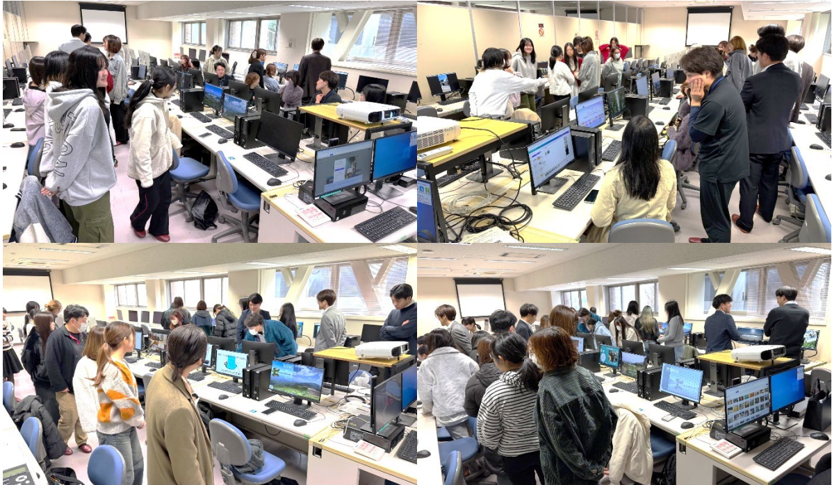
図5：岩手大学学生と遠野市職員の共同ワークショップの様子