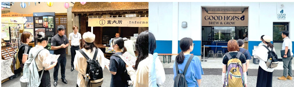
図2：遠野市内における各所の見学